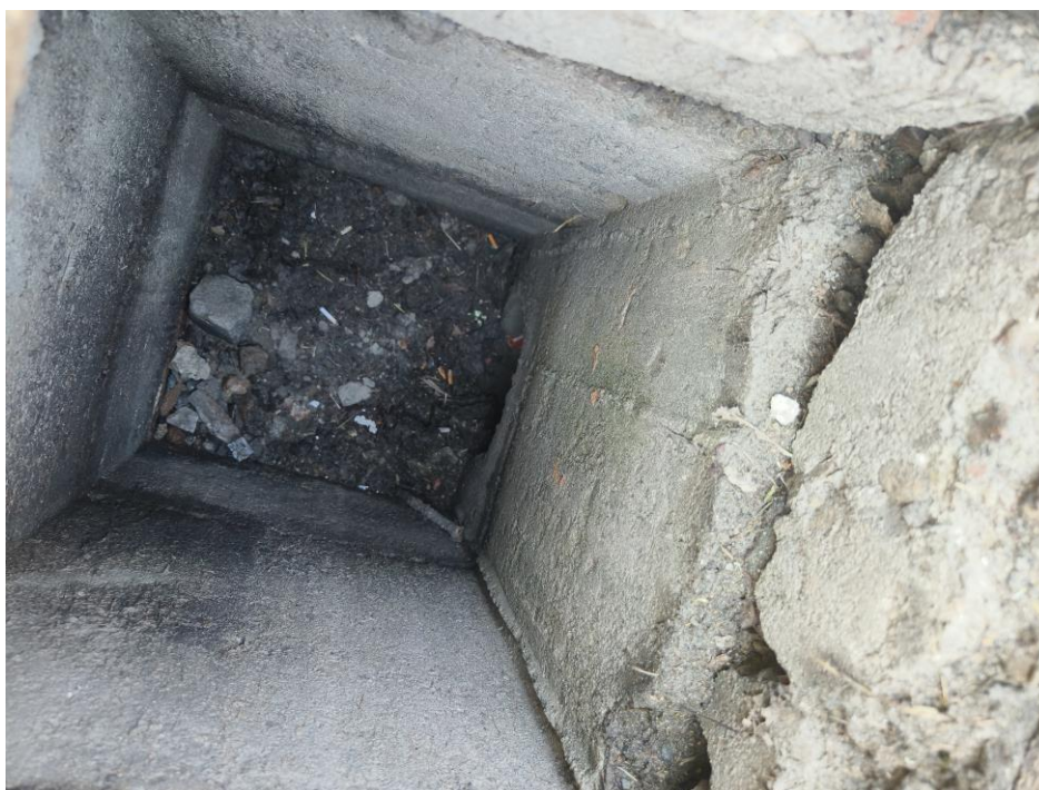
Obrázek č.2 – stávající uliční vpust

Odvodnění komunikace zůstává zachováno, tj. řešeno příčným a podélným sklonem do uličních vpustí, umístěných podél obruby. Jejich současný stav není vyhovující, jednak ze stavebnětechnického hlediska samotných vpustí a také s ohledem na nedostatečnou rovinnost dlážděného krytu v okolí vpustí, pozbývají tak svoji funkci. Nelze jednoznačně stanovit průběh odtoku z uličních vpustí do stávající obecní kanalizace.