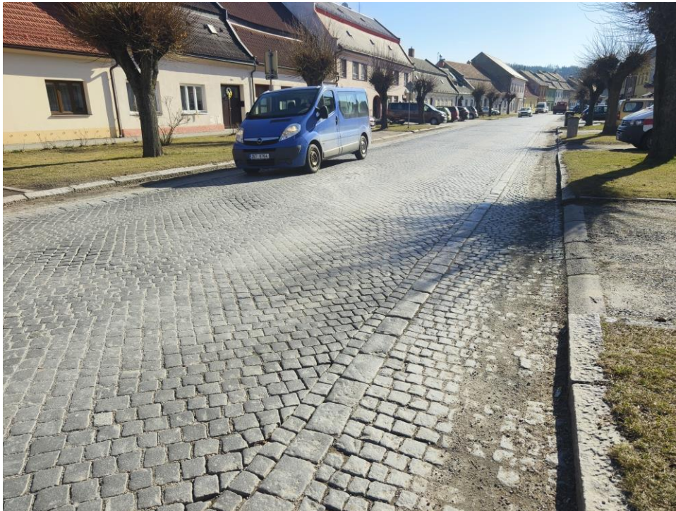
Obrázek č.4 – skladba dlažby

Dlážděný kryt vozovky je navržen jednotně v celé stavbě – kostka žulová drobná (8x10 cm). Skladebně bude nová dlažba respektovat současný stav. V hlavní ploše jízdnic pruhů se jedná o uhlopříčnou dlažbu, kdy řádky dlažby se osazují v úhlu 45° k podélným obrubám, přičemž je na ukončení řádků u obrub zapotřebí kostek úhlopříčně půlených (trojbokých). Dlažba může takto probíhat přes celou vozovku. Ve vzdálenosti 1,0 m od obruby bude umístěna vodící proužek , tvořený řádkem velké a drobné kostky . Zpevněná krajnice mezi vodícím proužkem a obrubou bude mít řádkovou skladbu , řádky uloženy kolmo k ose komunikace. Uvažuje se veškeré použití původních kostek, u hlavní plochy (KSÚSV) nutnost nákupu nového materiálu v 5 % plochy, u krajních 0,5 m pruhů (Městys Jimramov) 10 % nové dlažby.