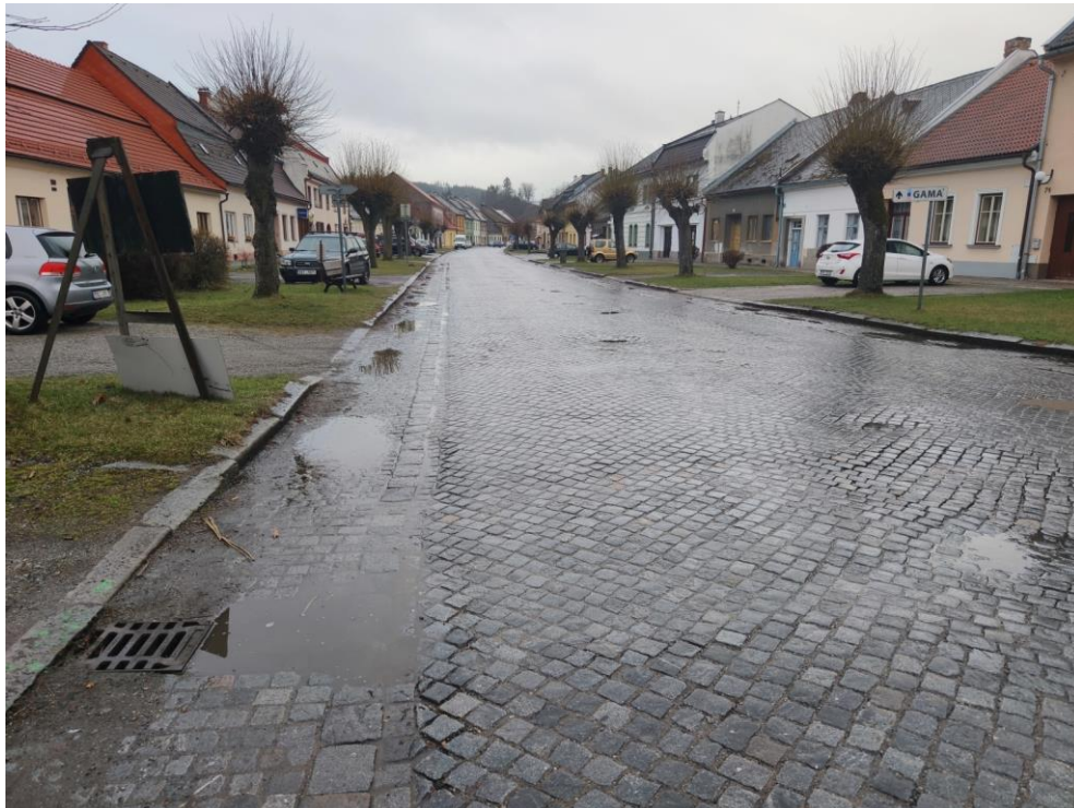
Obrázek č.1 – současný stav vozovky při deštivém počasí

Městys Jimramov hodlá současně s rekonstrukcí silnice stavebně upravit stávající sjezdy k nemovitostem, resp. parkovací místa mezi vozovkou a chodníkem podél zástavby náměstí. Účelem toho je především zlepšit podmínky pro rezidenty Jimramova z pohledu možnosti a kvality parkovacích míst. Podmínkou pro realizaci je dodržení parametrů památkové ochrany – viz Rozhodnutí MěÚ Nové Město na Moravě.