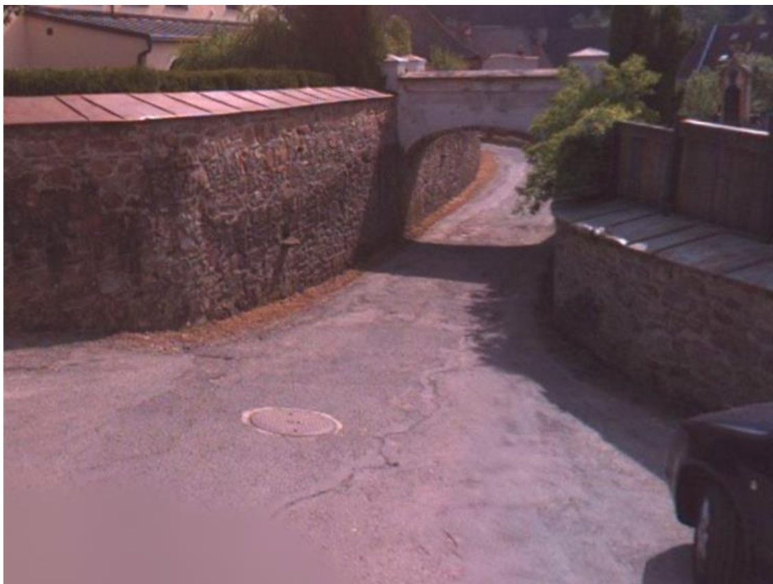
Obr. 1 – ZÚ ulice Kostelní