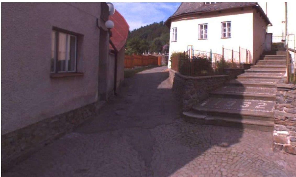
Obr. 4 - KÚ Kostelní