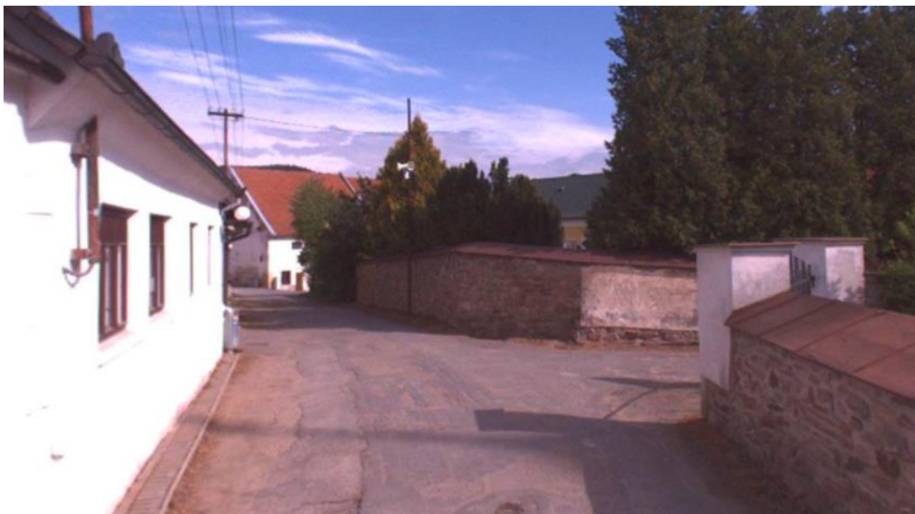
Obr. 7 - Panská