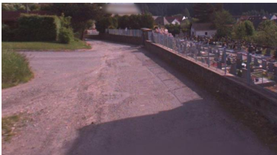
Obr. 5 – ZÚ Panská