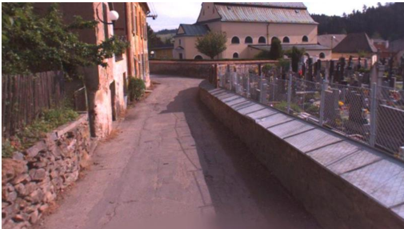
Obr. 6 – Panská